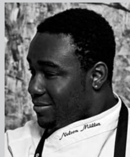
Nelson Müller (Fernsehkoch) Restaurant Schote, Essen